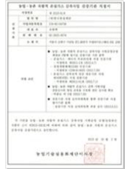
농업농촌 자발적 감축사업 검증기관 지정서