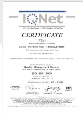
From : 한국 (한국품질재단 인증서)