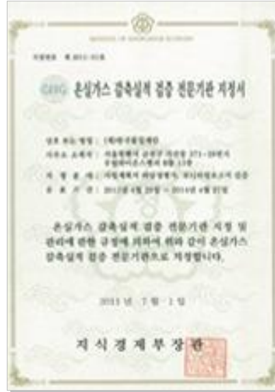
온실가스 감축실적 검증 전문기관 지정서