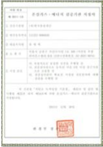
온실가스-에너지 검증기관 지정서