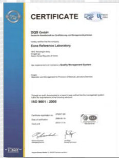
To : 독일 (DQS 인증서)