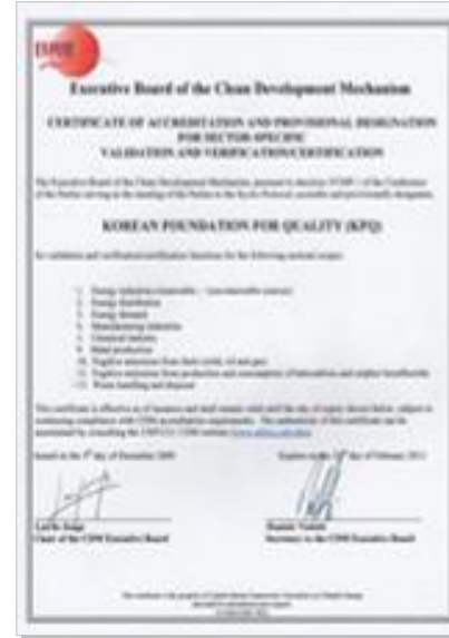
CDM DOE 지정서